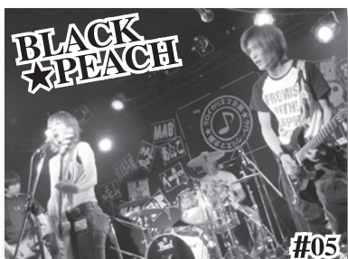
BLACK PEACH #05