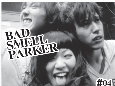
BAD SMELL PARKER #04

♪ 優しい風の中で / Start days!! チャンス / 空も飛べるはず アリガトウ。